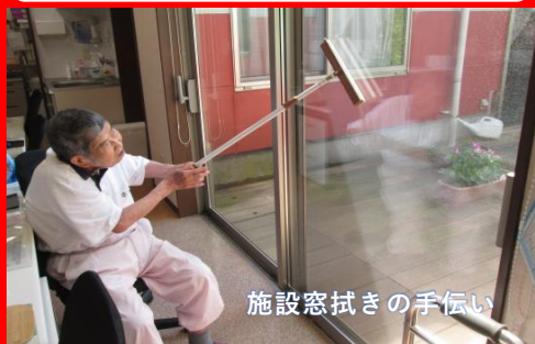
施設窓拭きの手伝い