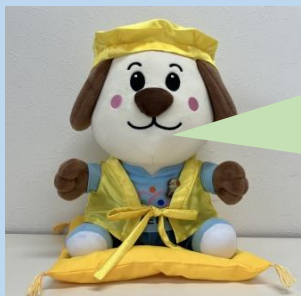
全国老健施設キャラクター「ろうけんくん」(敬老仕様)