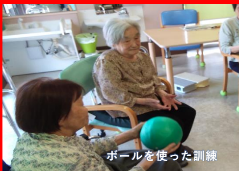
ボールを使った訓練