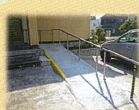
家屋改修のご相談