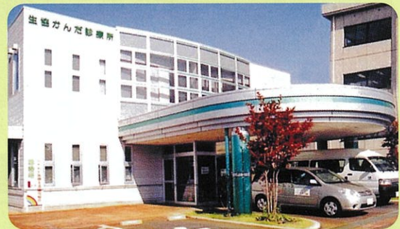
生協かんだ診療所 (内科・循環器内科) 長岡市西新町2-3-22 TEL32-2887 FAX39-9403