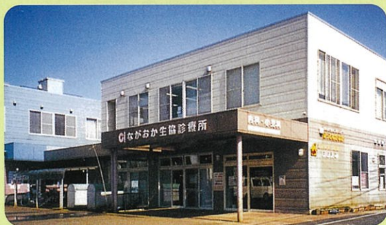
ながおか生協診療所 (内科・消化器内科) 長岡市前田1-6-7 TEL39-7001 FAX30-1172