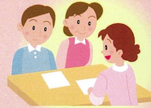
ご家族等への介護支援・相談

介護保険の訪問看護サービスは、訪問看護が必要な要支援・要介護者に提供されます。また、これらの要介護者等であっても、末期がん、厚生労働大臣が定める疾病等、急性増悪期の訪問看護は介護保険のサービスの対象を外れ、医療保険から訪問看護を受けることになります。