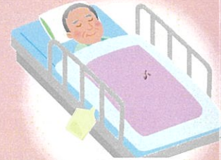
ターミナルケア・カテーテルなどの管理