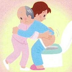
食事(栄養)指導管理 排泄の介助・管理