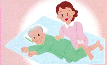
床ずれの予防と処置