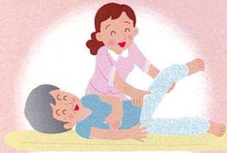
リハビリテーション