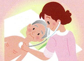
医師の指示による診療の補助業務