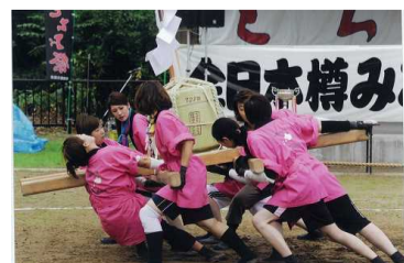
樽みこし綱引き大会(栃尾)