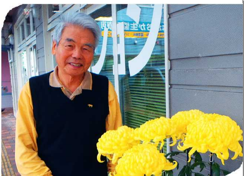
今月のすこやかさん