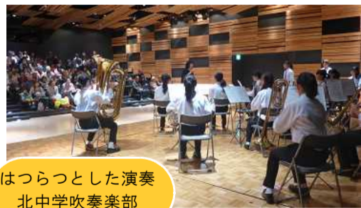
はつらつとした演奏 北中学吹奏楽部

12時45分、交流ホールAでは黒太鼓愛好会のみなさんによる勇壮な太鼓の音で午後の部が開幕しました。司会中村理事の紹介で、北中学校吹奏楽部の皆さんの演奏では、皆さん一緒に口ずさみいい雰囲気でした。長岡農業高校音楽部の皆さんからは、迫力の演奏。「北酒場」など大いに盛り上がりました。アンサンブル・リリックのしつとりとした演奏で閉めくられました。