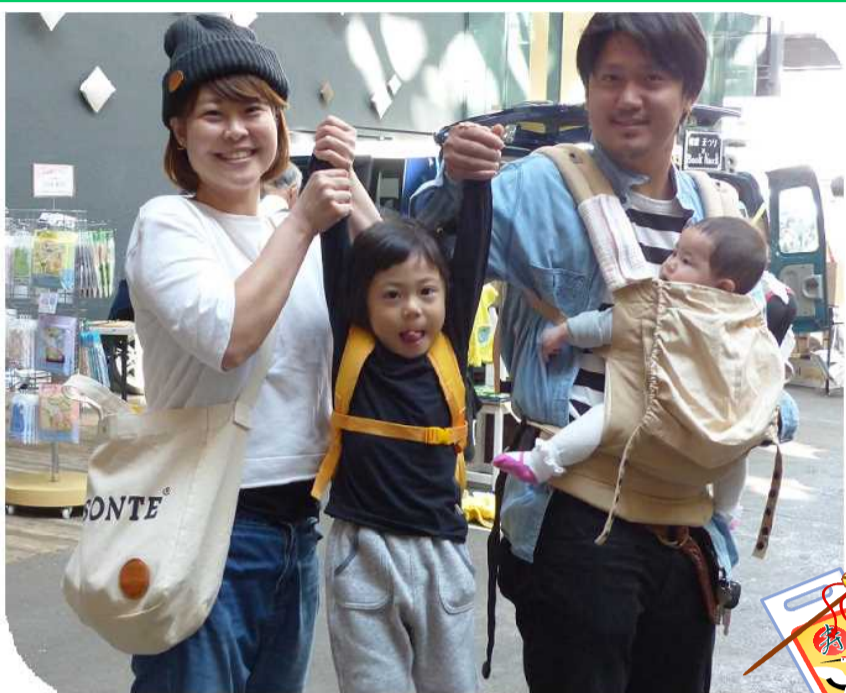
今月のすこやかさん

発行：ながおか医療生協本部 〒940-0042 長岡市前田1丁目6番7号 TEL 0258-38-0813 FAX 0258-30-1160 http://www.nagaoka-iryuu-seikyuu.jp/